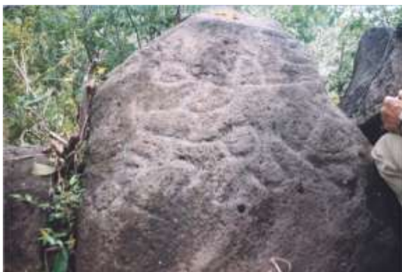
Fig. 5 La piedra del Letrero, Municipio de Chalatenango