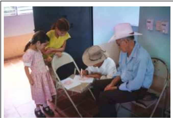
Fig. 4 Pobladores dibujando un encanto de luz (el carbunco)