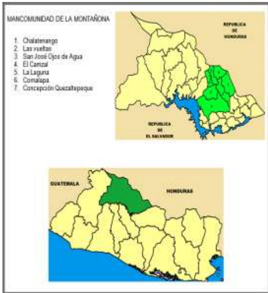
Fig. 1 Cuadro de ubicación del departamento de Chalatenango, y de la Micro-región La Montañona

La extensión territorial de La Montañona es de 335 km 2 que equivale al 17% del territorio del Departamento de Chalatenango; y cuya área la comparten 7 municipios: Las Vueltas, Ojos de Agua, El Carrizal, La Laguna, Comalapa, Concepción Quezaltepeque y Chalatenango; siendo este último el municipio más extenso, con 131.8 km 2 y los más pequeños El Carrizal y La Laguna, con 25 km 2 .