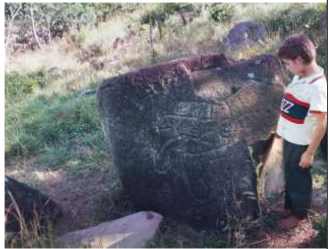
Fig. 6 Niño junto al grabado llamado por la comunidad como "Los 7 monos"